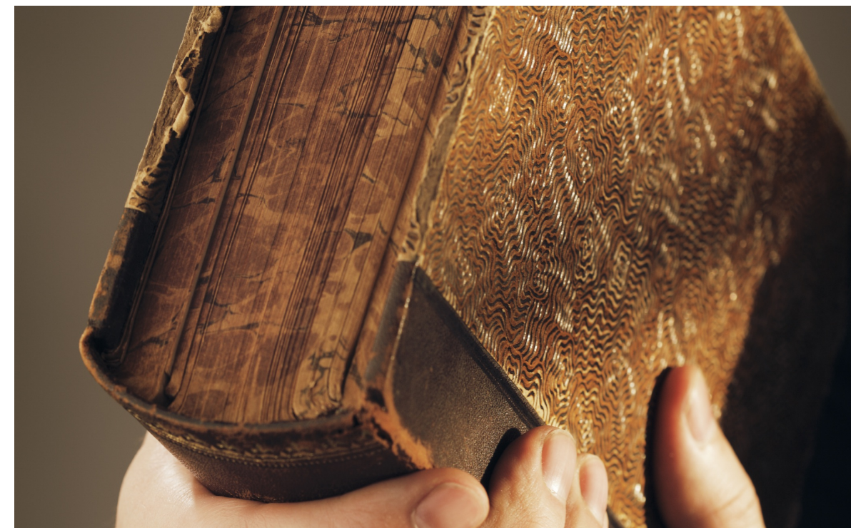
Osvaldo Alfredo Gozaini